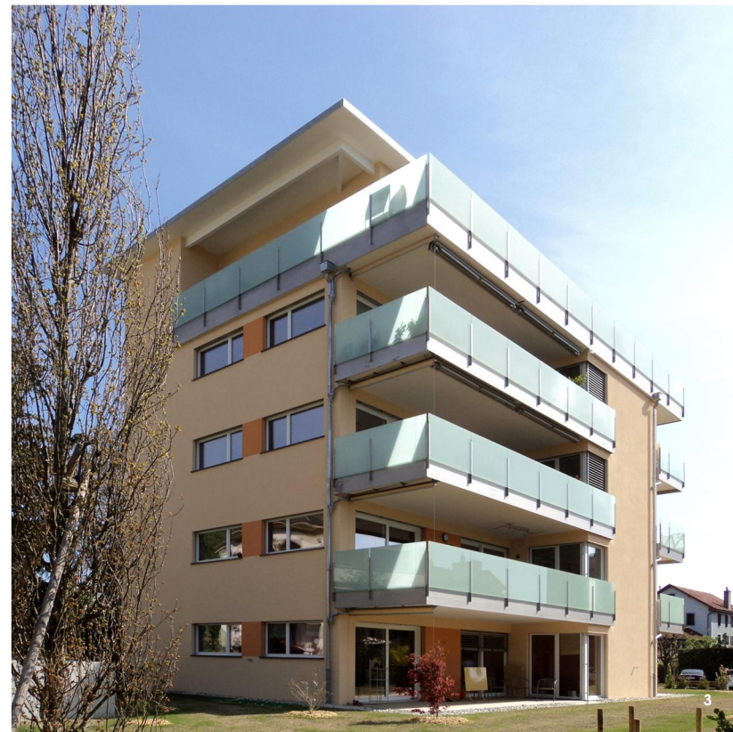
3 Vue Sud-Ouest 4 Vue balcons